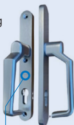
Standard blank eloxiert

Bitte beachten Sie eine Änderung bezüglich der Lieferung der Türgriffe. Während im Newsletter 57 die Verfügbarkeit ab Q2 erwähnt wurde, wird die Lieferung nun aufgrund einer kleinen Verzögerung in der Lieferung erst in Q3 beginnen. Diese Qualitätsverbesserung bleibt kastenfrei.