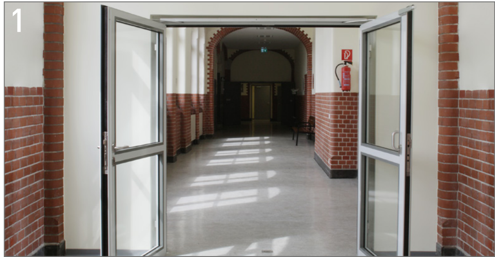
Bild 1 Nachträglich eingebaute Brandsabschnitte kombiniert mit NovoFire® Tür T30/ EI 2 30C 5 Sm.

In dem stark genutzten Schulgebäude, in dem so viele Kinder lernen, wird Sicherheit groß geschrieben. Daher wurde mit hochwertigen Brandschutztüren systematisch ausgerüstet. Ob 1- oder 2-flügelig, bei den NovoFire-Türen gemeinsam ist eine exzellente Qualität bis ins Detail. Sie verfügen über Obentürschließer mit Feinjustierung, präzise gearbeiteten Fallen und exakt passenden Dichtungen.