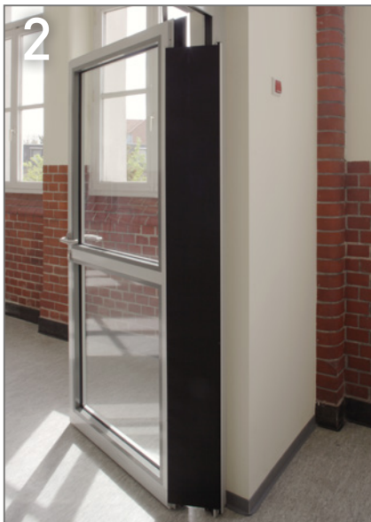
Bild 2 NovoFire® Tür T30/ EI 2 30C 5 Sm mit Fingerklemmschutz zur Absicherung der Nebenschließkanten, wirksam gegen unbeabsichtigtes Einklemmen der Finger zwischen Türblatt und Zarge.

In der visuellen Wahrnehmung sind alle hier verbauten Brandschutztüren gleich, tatsächlich aber ist jede ein Unikat. Die konstruktiv abgestimmte Kombination der einzelnen Komponenten und die werkseitige Vormontage der Türen sichern eine hohe Funktionalität und lange Lebensdauer. Die neuen Brandschutzabschnitte mit ihren wertigen NovoFire®-T30 Alu-Rohrrahmentüren geben Sicherheit und unterstreichen in ihrer lichtvollen Offenheit das attraktive architektonische Zusammenspiel von Tradition und Moderne.