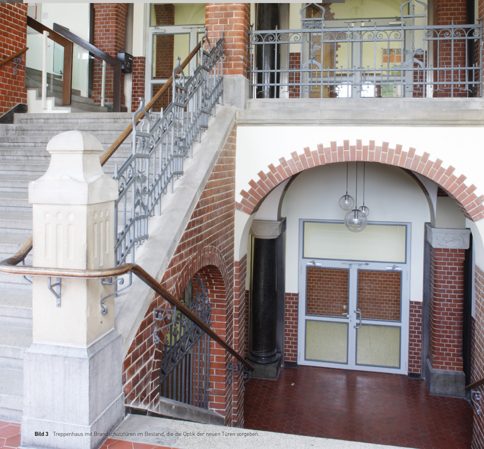
Bild 3 Treppenhaus mit Brandschutztüren im Bestand, die die Optik der neuen Türen vorgeben.