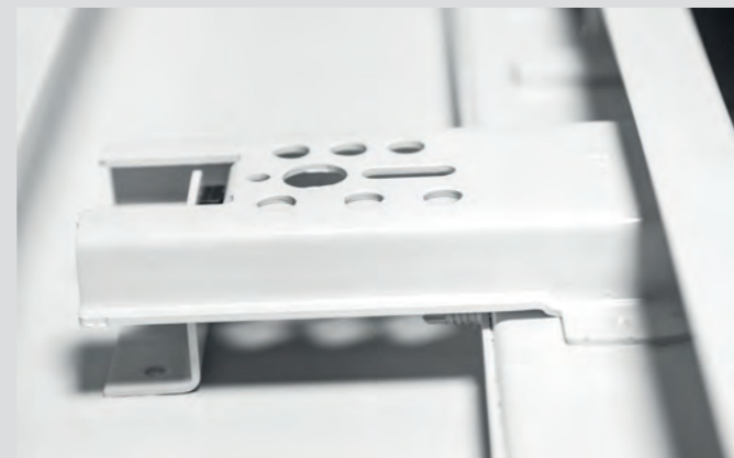
Darstellung des Ankersystems mit Trapez- und Gegenanker (Standard für alle 2-schaligen Zargen).