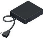
NOVOFERM HOMEMATIC IP MODUL