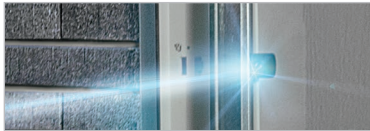
LICHTSCHRANKE FÜR GARAGENTORE